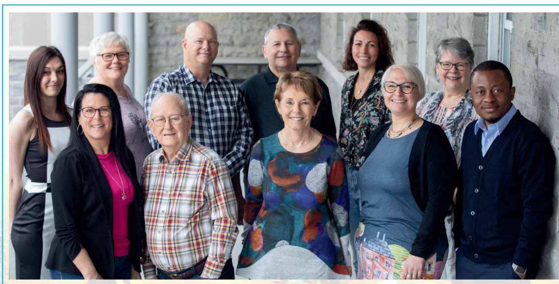
L'équipe de travail d' Aux Couleurs de la Vie Lanaudière